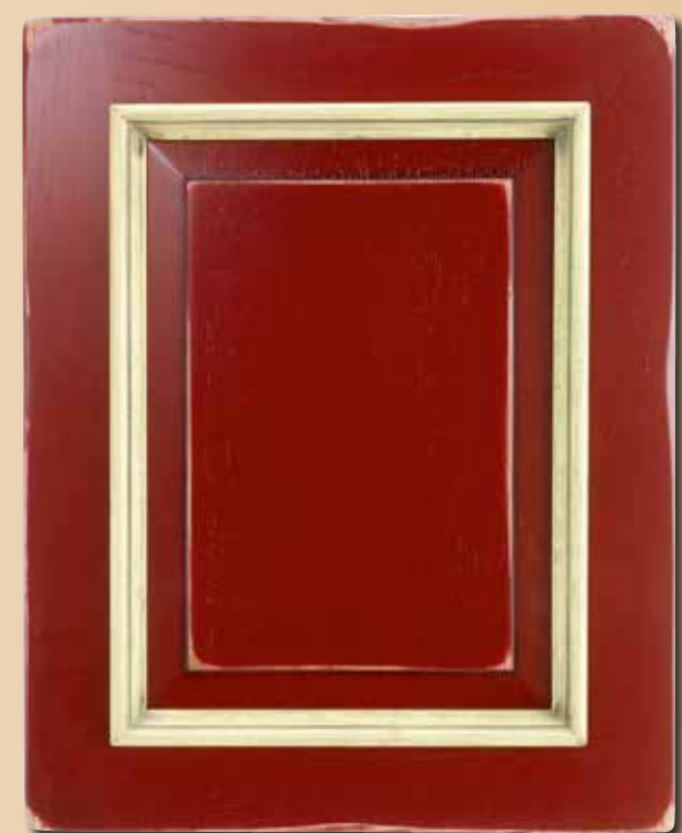
CASTAGNO LACCATO CA - 3011 CON CORNICE LACCATA CA - 1015 LACQUERED CHESTNUT CA - 3011 WITH LACQUERED CORNICE CA-1015