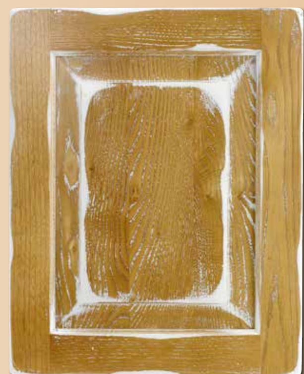
CASTAGNO LACCATO E LEVIGATO CA - LL LACQUERED SANDED CHESTNUT CA - LL