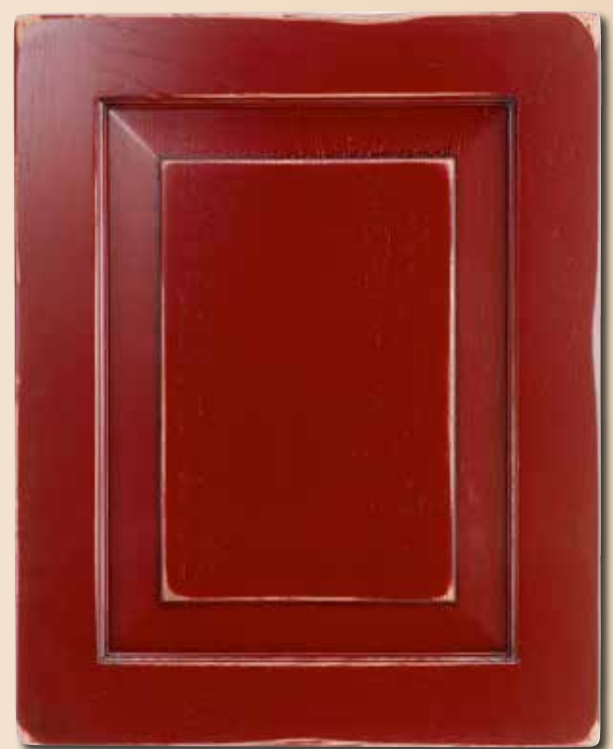
CASTAGNO LACCATO CA - 3011 LACQUERED CHESTNUT CA - 3011