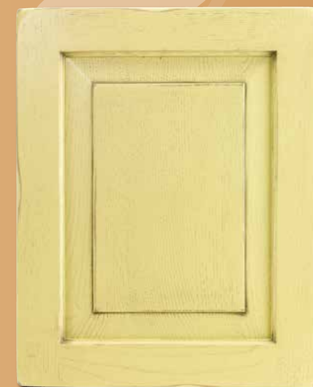
CASTAGNO LACCATO CA - 1014 LACQUERED CHESTNUT CA - 1014