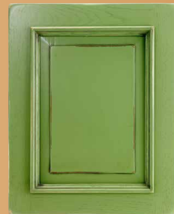
CASTAGNO LACCATO CA - VI CON CORNICE LACCATA CA - VI LACQUERED CHESTNUT CA - VI WITH LACQUERED CORNICE CA-VI