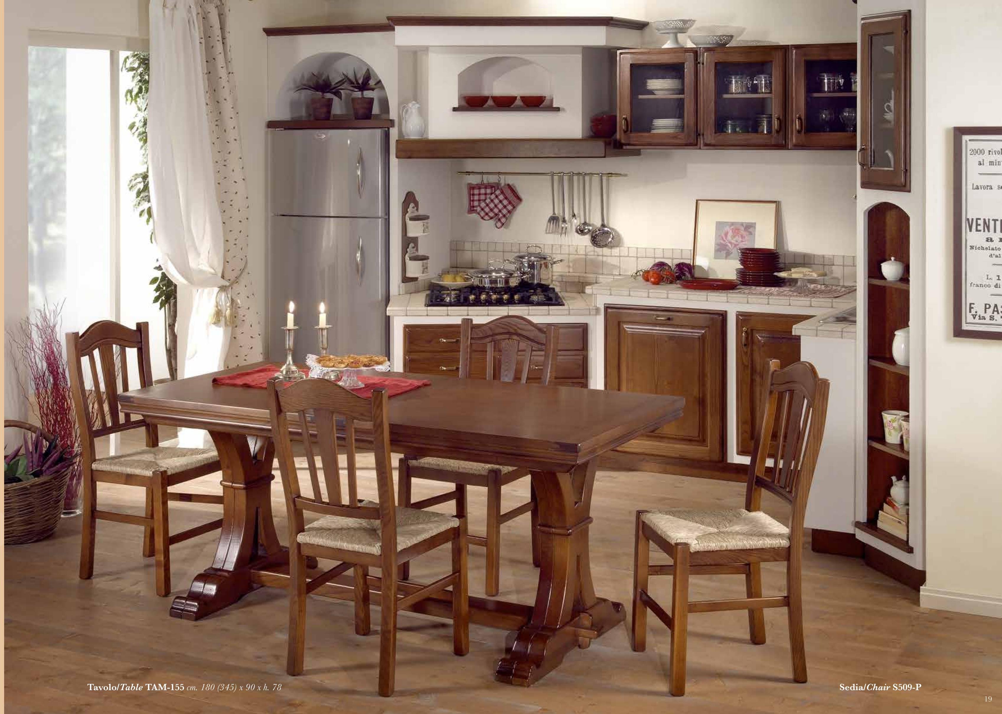
Tavolo/Table TAM-155 cm. 180 (345) x 90 x h. 78

The Il Casolare kitchen instills serene harmony that will remain in style long after passing fashion trends have come and gone.