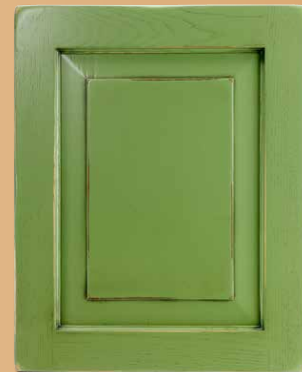
CASTAGNO LACCATO CA - VI LACQUERED CHESTNUT CA - VI