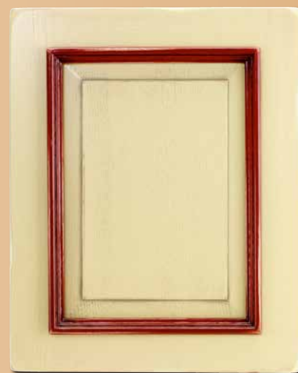
CASTAGNO LACCATO CA - 1015 CON CORNICE LACCATA CA - 3011 LACQUERED CHESTNUT CA - 1015 WITH LACQUERED CORNICE CA-3011