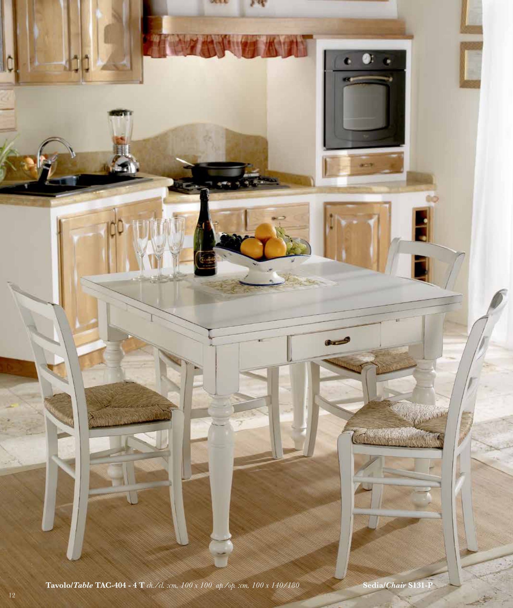
Tavolo/Table TAC-404 - 4 T ch./cl. :cm. 100 x 100 ap./op. :cm. 100 x 140/180