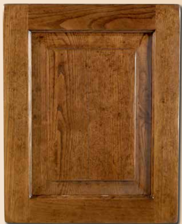
CASTAGNO ANTICO CA - 2 - AN AGED CHESTNUT CA - 2 - AN